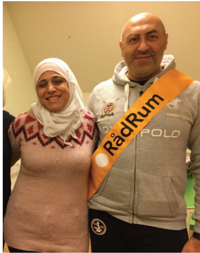
Dari / Persiska

info@radrumskane.se www.facebook.com/radrumskane www.radrumskane.se